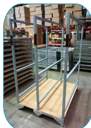
EN POSITION DE "W"