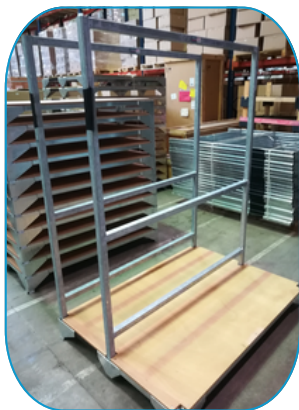
EN POSITION DE "L" + "T"

Le dossieret peut avoir différentes positions afin de s'adapter à vos besoins.