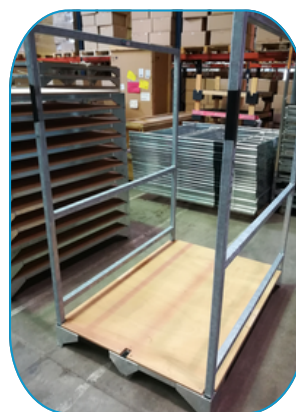
EN POSITION DE "U"

Le dossieret peut avoir différentes positions afin de s'adapter à vos besoins.