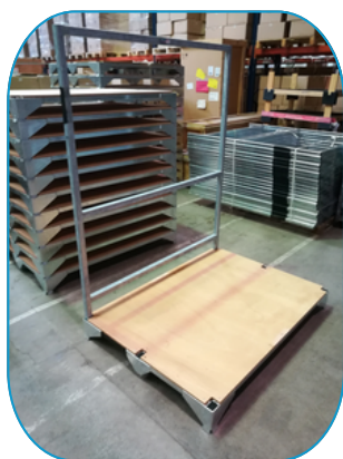
EN POSITION DE "L"